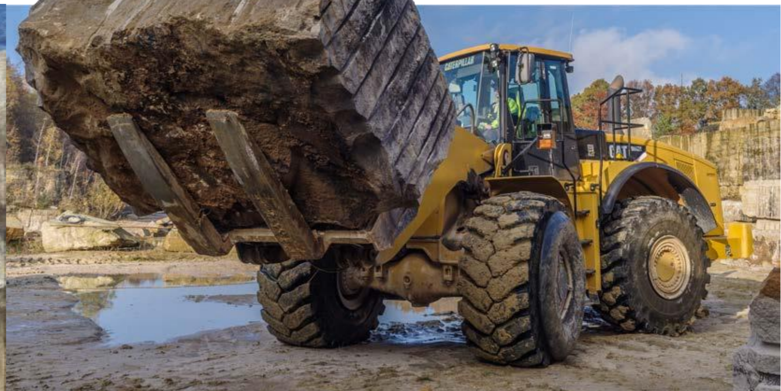
1895 Moderní stroje dnes pomáhají dělníkům v lomu