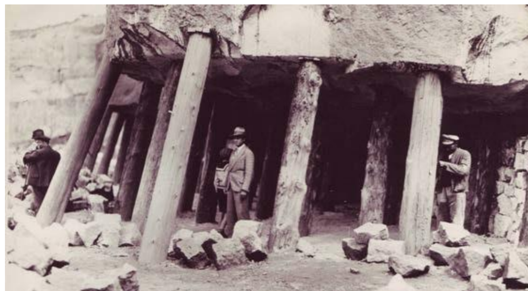
"Stěnové pády" v lomu Lohmgrund II, kolem roku 1939

Archeologická rekonstrukce drážďanského kostela Frauenkirche s nezaměnitelnou a samonosnou pískovcovou kopulí se stala synonymem pro firmu a saské kamenictví.