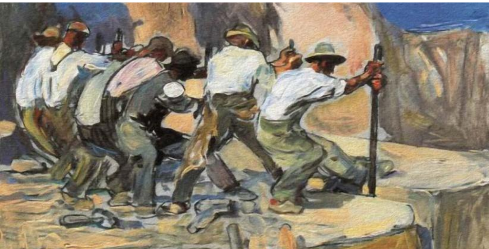
Robert Sterl: Lomoví dělníci, obraz