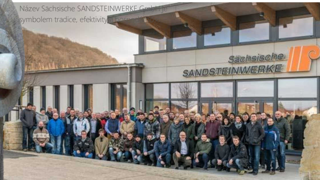
Sídlo společnosti a zaměstnanci společnosti Sächsische SANDSTEINWERKE GmbH

Název Sächsische SANDSTEINWERKE GmbH je symbolem tradice, efektivity a hospodárnosti.