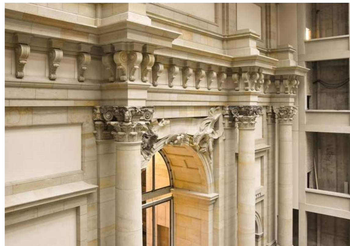
Eosanderův portál uvnitř, Berlínský palác

z našich 6 kamenolomů, odborné poradenství zákazníkům, často nezbytná měření na místě, plánování a realizace technologie kamene, výroba fasádních desek, polotovarů a hotových výrobků až po kompletní řešení z jedné ruky, včetně restaurátorských prací.