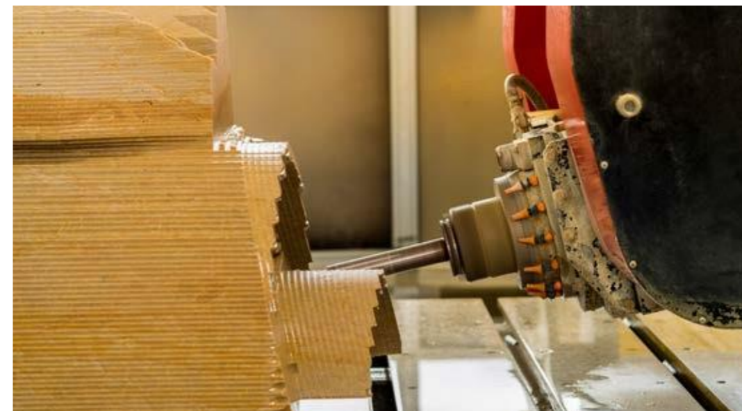
CNC řízený stroj